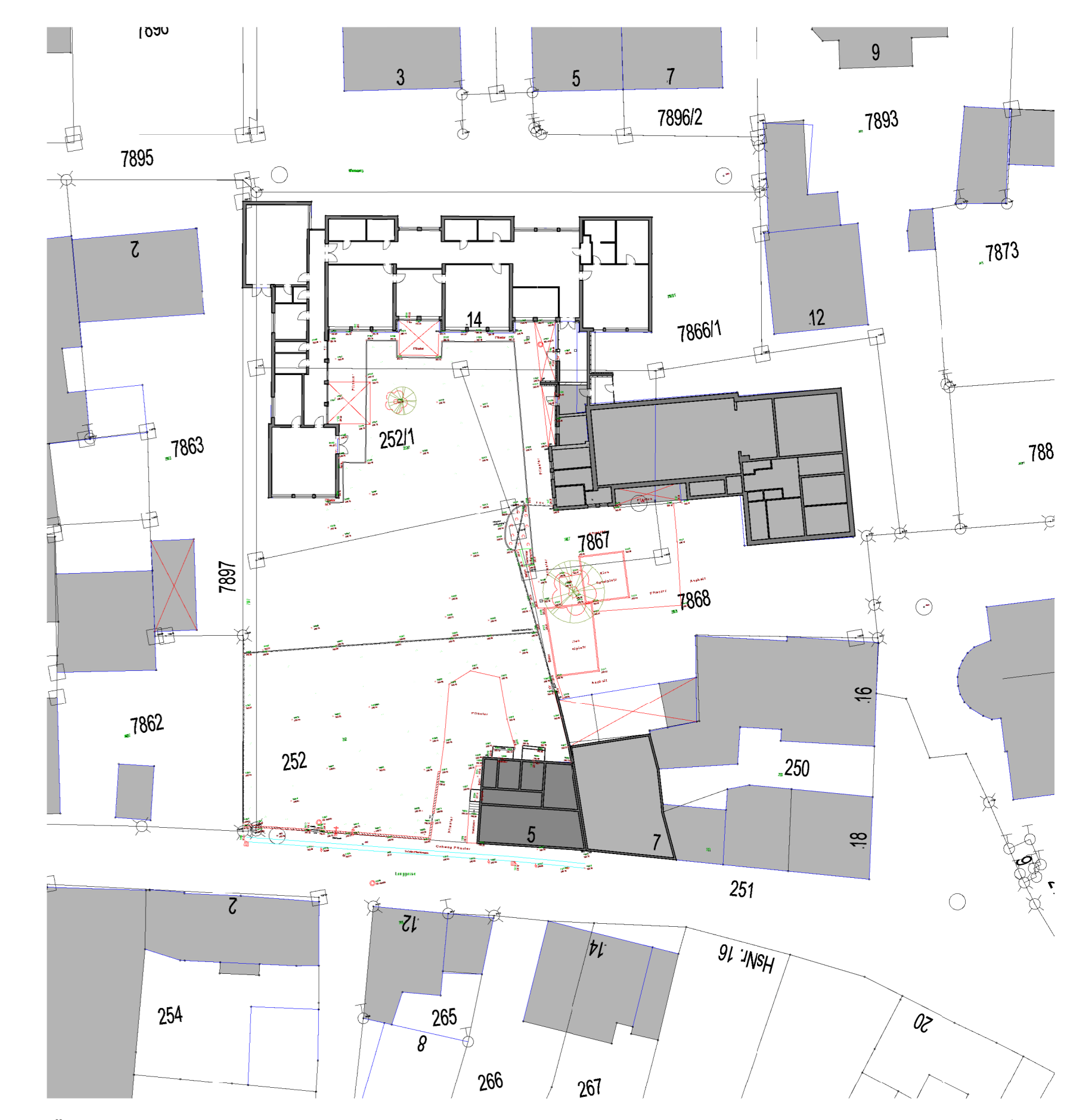
Übersichtsplan Bestand - M 1:1000