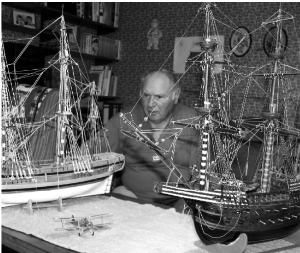
Billingshausen, im Juni 2017

auf seinem letzten Weg begleitet haben und ihre Anteilnahme durch Wort und Schrift, Blumen und Geldspenden zum Ausdruck gebracht haben.